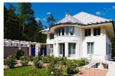
Maison Blanche – La Chaux-de-Fonds

Accueil de l'Amopa section Doubs dans le canton de Neuchâtel par l'Amopa section de Suisse samedi 6 octobre 2018