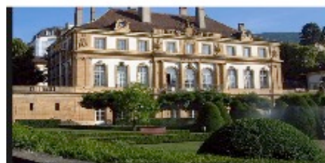
Hôtel DuPeyrou – Neuchâtel